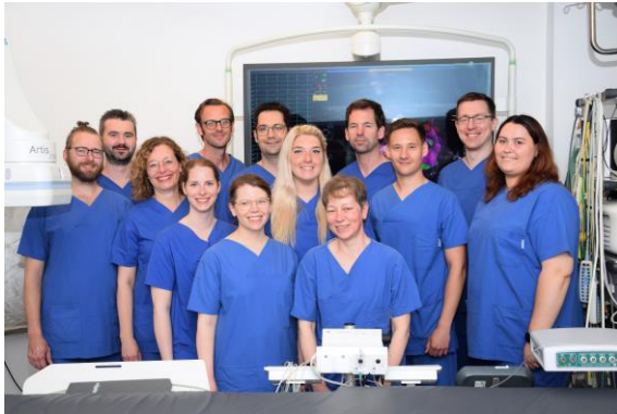
Das Team der Rhythmologie am Marienhospital im Herzkatheterlabor.