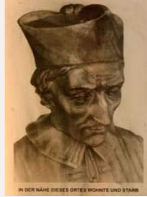
Seligsprechung Niels Stensen 1988