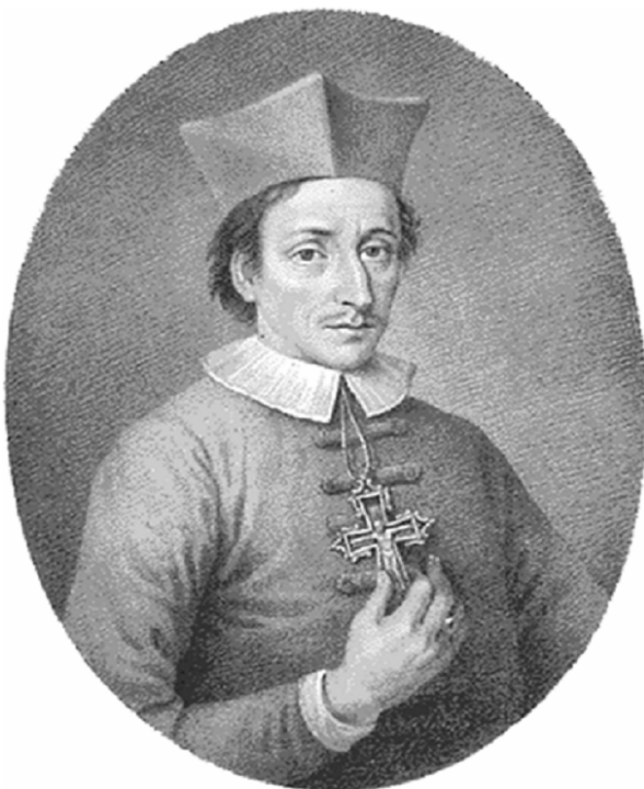
Niels Stensen Naturwissenschaftler, Arzt Geistlicher und Bischof

Niels Stensen (1638-1686) war Mediziner und Wissenschaftler und zugleich ein tiefgläubiger Mensch. Stensen schlug eine brillante wissenschaftliche Karriere aus, um Priester und später Bischof zu werden. Die Sorge um seine Mitmenschen, insbesondere um Arme und Notleidende, war der Motor seiner Arbeit. Sein Bischofswappen, ein Herz mit einem Kreuz, bringt symbolisch seinen Glauben, sein medizinisches Wirken und seine seelsorgliche Tätigkeit zum Ausdruck. Niels Stensen wirkte auch im Gebiet des Bistums Osnabrücks. Im Jahr 1988 wurde er, auch auf Betreiben des Bischofs von Osnabrück, selig gesprochen. Unser Logo greift das Bischofswappen von Niels Stensen auf. Damit drücken wir unsere Verbundenheit mit seiner Haltung aus und unseren Anspruch, unseren Patienten medizinisch, pflegerisch und seelsorglich in bester Weise zu helfen.