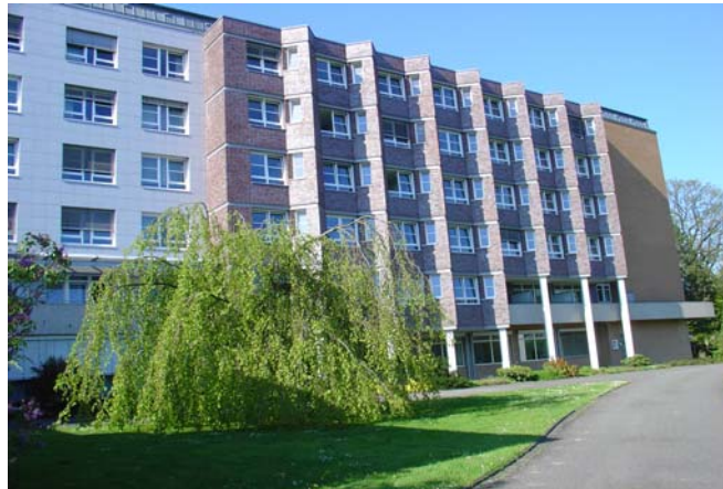
Abbildung: Das Krankenhaus St. Raphael liegt mitten im Ortskern von Ostercappeln. Hier sehen Sie die Frontansicht des Krankenhauses.

"Der Mensch liegt uns am Herzen" lautet das in unserem Leitbild verankerte Leitmotiv, dem wir uns in unserem Handeln verpflichtet fühlen. Qualitätsmanagement ist dabei für uns ein unverzichtbares Instrument, um unser Leitbild und unsere Qualitätsansprüche mit Leben zu füllen.